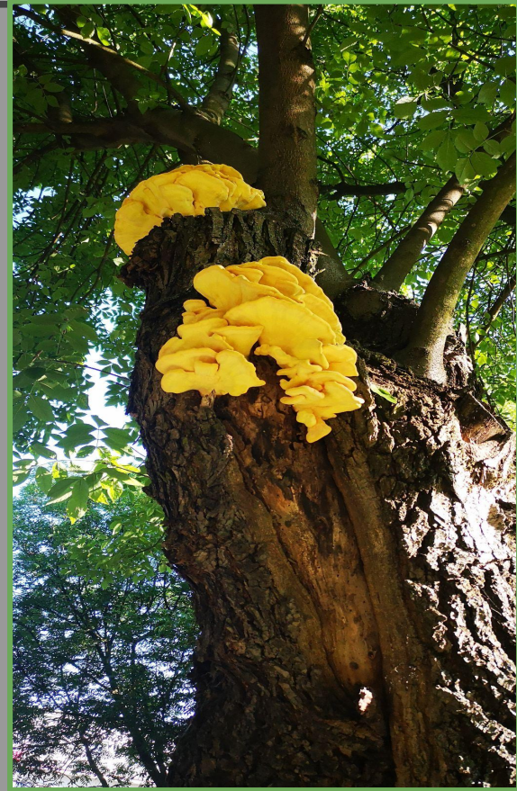
fot. Mariusz Warachim, Ciechocinek