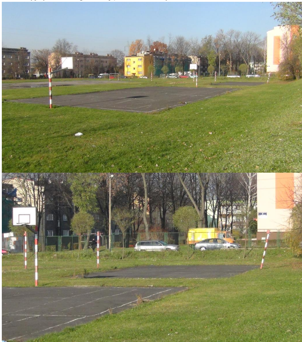
Zdjęcia własne (ZSO 2 w Dąbrowie Górniczej Gołonogu - listopad 2012)

poprzerastana trawą, liczne garby i ubytki, pozarastana trawą była bieżnia lekkoatletyczna i skocznia do skoku w dal - miejsce w latach dziewięćdziesiątych tętniące życiem sportowym, rekreacyjnym także poza zajęciami szkolnymi: