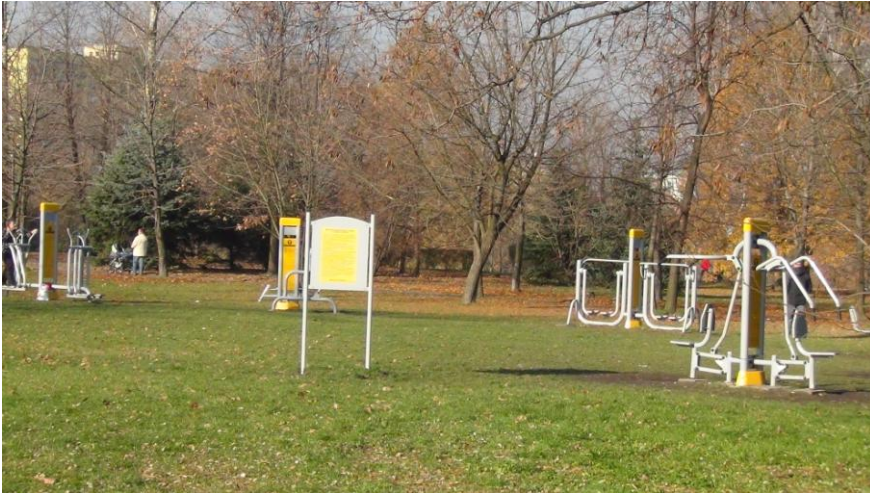
Siłownia zewnętrzna w Parku Hallera

Z informacji pozyskanych od Pełnomocnika Prezydenta mają sukcesywnie powstawać kolejne.